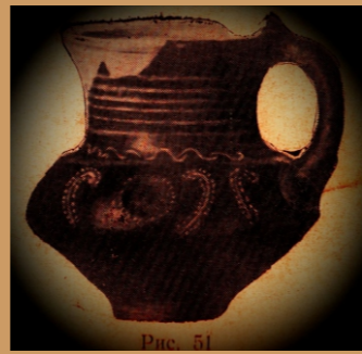
Kazılarda Ele Geçirilmiş Çömlekler