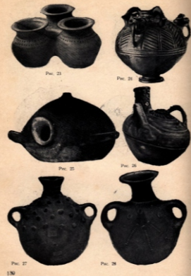
Kazılarda Ele Geçirilmiş Çömlekler