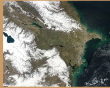
Hazar'ın Batısı Fiziki

XV- XVI yüzyıllarda bölgede Safeviler etkili oldu. 1577 Şirvan ve Şeki Lezgilerinin isyanı; 1583, 1601 Kuba isyanları, 1610 Şabran direnişi 1612'de Şah Abbas'ın Osmanlılarla anlaşmak zorunda kalmasını sağladı. 1620 Samur'da asayiş sarsan kıpırdanmalar, 1707'de geniş bölgeye yayılan isyanlar 1712'de Safevi iktidarını sarsacak boyutlara vardı.