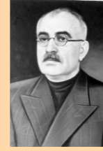
Mir Cafer Bağirov